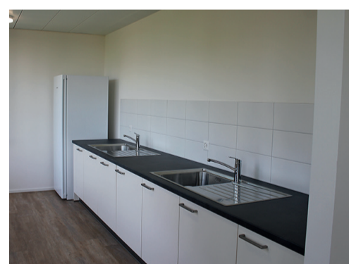
Le réfectoire et la cuisine sont des espaces communs équipés de bouilloires, de micro-ondes et de petit électroménager pour préparer les repas.