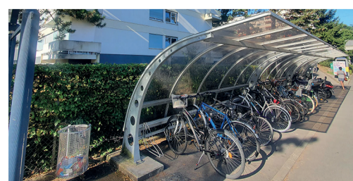
L'ancien abri à vélos de Pont-Céard a été démonté et sera prochainement agrandi.

Au cours du mois de février, l'abri à vélos de Pont-Céard a été démonté afin de permettre le début des travaux d'agrandissement de cette structure. Dans le courant du mois d'avril, deux abris seront installés face à face, offrant ainsi une soixantaine de places couvertes destinées aux deux roues.