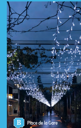
B Place de la Gare