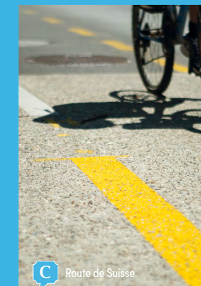
C Route de Suisse

Grâce à ses deux gares (Versoix et Pont-Céard) et les trains au quart d'heure, il est facile de se rendre dans les communes voisines et au-delà. Les lignes de bus 50, 54 et 55 des Transports publics genevois (TPG), un débarcadère de la Compagnie générale de navigation (CGN) et un réseau de pistes cyclables sont aussi des options pour vos déplacements.