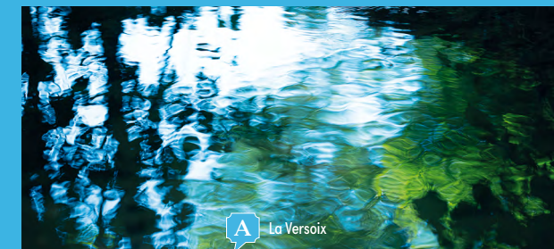
A La Versoix

Ville entourée d'un écrin de verdure, Versoix s'offre à vous au travers de nombreux itinéraires et tableaux somptueux au fil des saisons.