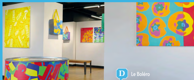
D Le Boléro

A pied, en bus ou à vélo, profitez des multiples activités culturelles proposées par le Boléro (Galerie & Bibliothèque) et les associations locales. Restez également en forme grâce aux infrastructures proposées par le Centre sportif de Versoix.