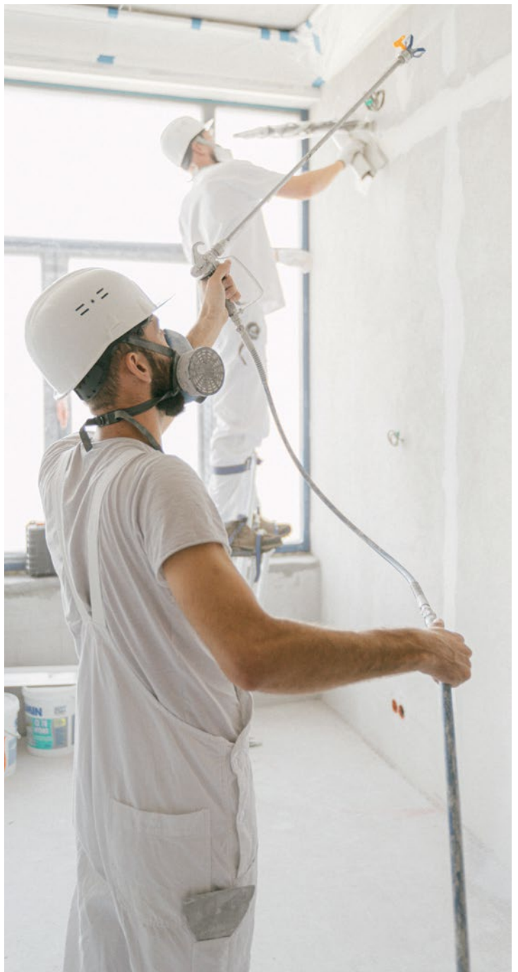
En Suisse, le taux de rénovation est de 1% par an.

Plus grand gisement d'émissions de CO 2 à ce jour, les bâtiments engloutissent à eux-seuls pas moins de 50% du bilan énergétique du canton. Une épine dans le pied au regard de la Stratégie 2050 du pays... Alors que le taux de rénovation helvétique stagne à 1% par année, il est prévu qu'il atteigne les 2,5% dans le canton de Genève à l'horizon 2030. «Pour accomplir notre politique climatique extrêmement ambitieuse, nous avons mis en place une sorte de bâton pour les retardataires, avec le nouveau règlement sur l'énergie, et des carottes comme ce programme, pour avancer plus vite. Maintenant il faut y aller», appuie Antonio Hodgers.