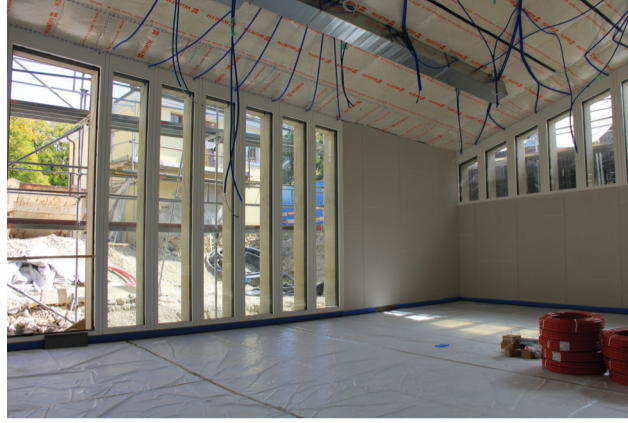
L'intérieur du futur restaurant scolaire.

Les travaux de Bon Séjour vont bon train. Une première étape s'est achevée à Pâques 2019 avec la remise du bâtiment de l'Ancienne Préfecture, dans lequel plusieurs associations ont pu reprendre leurs activités. Parallèlement, le gros œuvre des autres bâtiments a avancé: l'enveloppe des restaurants scolaires, de la tourelle et de l'entrée des caves de Bon Séjour ont été terminés au cours de l'été.