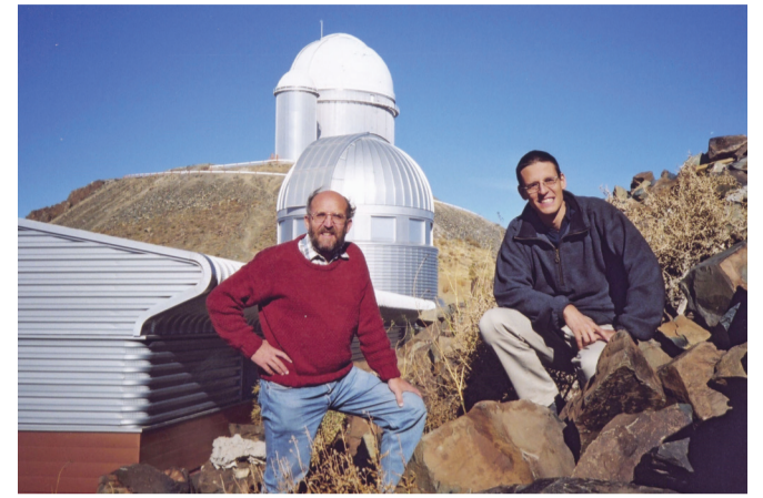
Michel Mayor et Didier Queloz à l'observatoire de La Silla (Chili)

Cet événement est susceptible d'être annulé selon les directives fédérales Covid-19