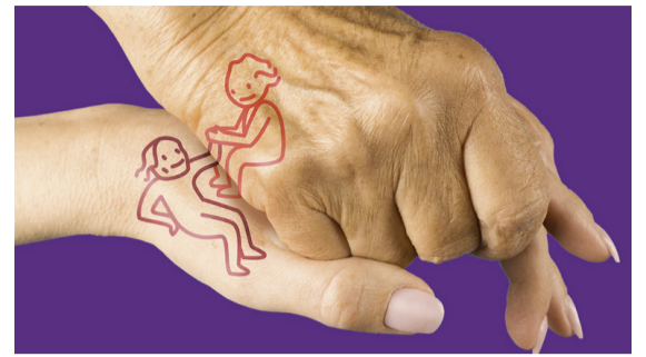
Les proches aidants sont des personnes aidant régulièrement et bénévolement des parents, voisins ou amis en raison de leur âge, de leur santé ou de leur handicap.

Ce sondage devrait inviter les communes à mettre en place des conditions cadres permettant de mieux répondre aux exigences de cette forme de solidarité. Suite à ce questionnaire, des mesures seront étudiées par le GCRDL.