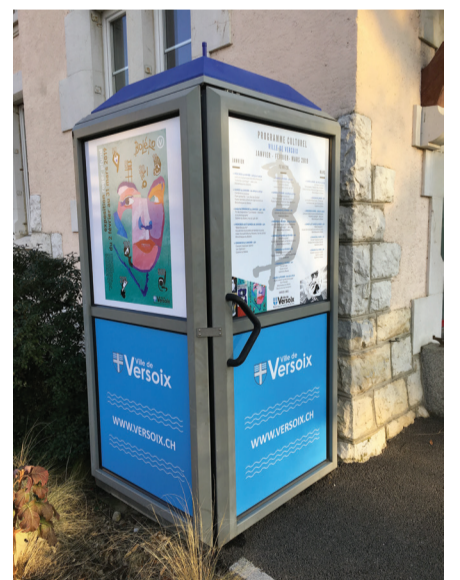
Cabine téléphonique à proximité de la Place de la Gare

La Ville de Versoix a décidé d'offrir une seconde jeunesse aux trois cabines téléphoniques installées sur son territoire et les intègre, depuis la fin de l'année dernière, à ses supports de communication. Situées au chemin de Pont-Céard, à l'angle de la route de Sauvigny et à proximité de la Place de la Gare, ces cabines téléphoniques sont décorées au grès des manifestations communales tels que Festichoc ou les expositions proposées par la Galerie du Boléro.