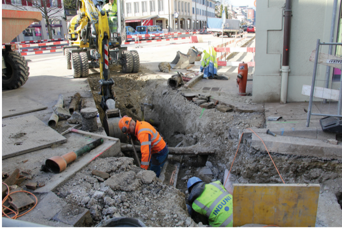
Travail sur le collecteur à la sortie du quai de Versoix (côté Lausanne)

Le travail sur un collecteur d'eaux usées situé à l'extrémité du quai de Versoix a nécessité la fermeture de son accès côté Lausanne durant quelques semaines. Dès le 1 er avril, le sens unique sera rendu. Les places de parc seront à nouveau en épi, dans le sens inverse, pour une durée d'environ 3 mois. Les marquages au sol seront adaptés pour faciliter le stationnement.