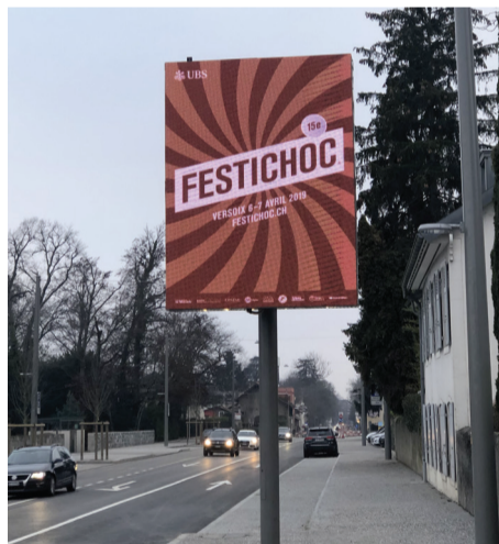
Panneau situé au carrefour de Montfleury

Deux panneaux ont récemment été installés, un au niveau de Montfleury au bord la route de Suisse, l'autre au bord la route de l'Etraz (direction Genève). Ils diffusent en boucle entre 6h00 et 22h00 une liste d'environ 6 visuels concernant les manifestations qui ont lieu à Versoix.