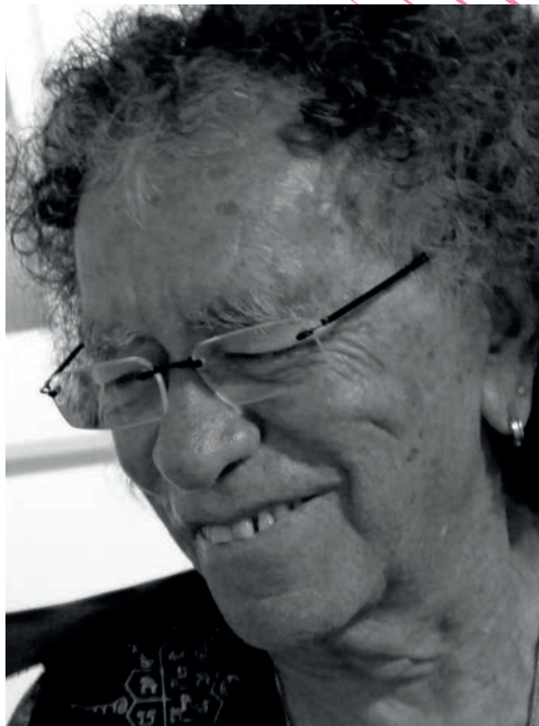
José Barrense- Dias

« La critique internationale l'a désigné comme l'un des grands maîtres de la guitare brésilienne, ambassadeur d'une musique profonde et inaltérable. Quand il ne joue pas de son instrument, c'est avec ses pinceaux qu'il met sa musique et ses rêves en couleurs. Vive et bariolée, comme le carnaval au Brésil, sa peinture est sans aucun doute le prolongement de sa musique. La preuve : il peint ses guitares ! »